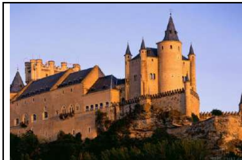
1. Замок Альказар, Испания